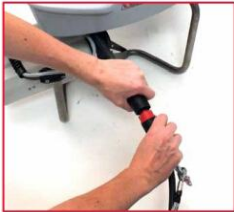
将动力电缆接入设备插座