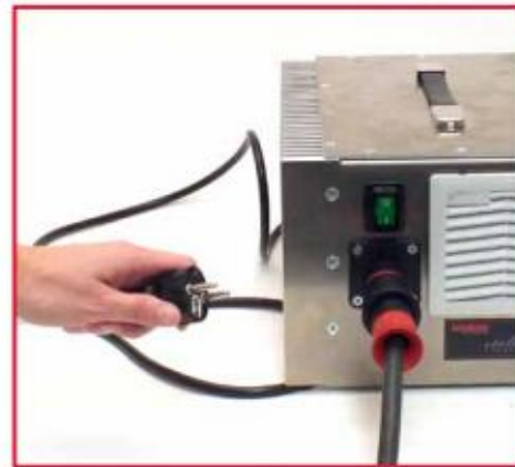
使电源插头与 110/220V 插座连接