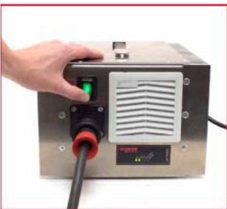
按下“O/I”开关，打开电源