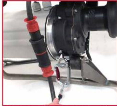
使电缆的弹簧锁扣紧紧地扣在电缆锚顶吊环上。