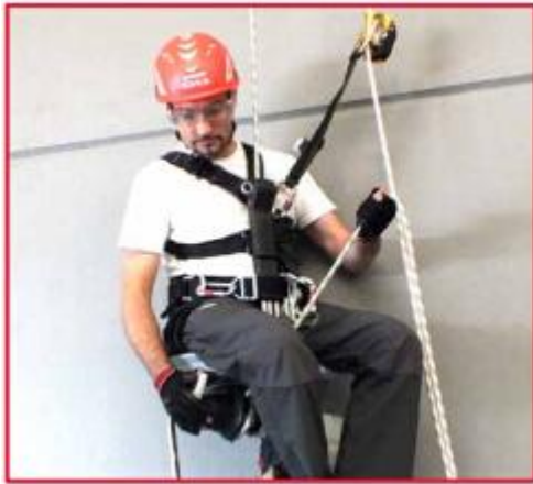
用一只手抓住离开摇柄的绳索