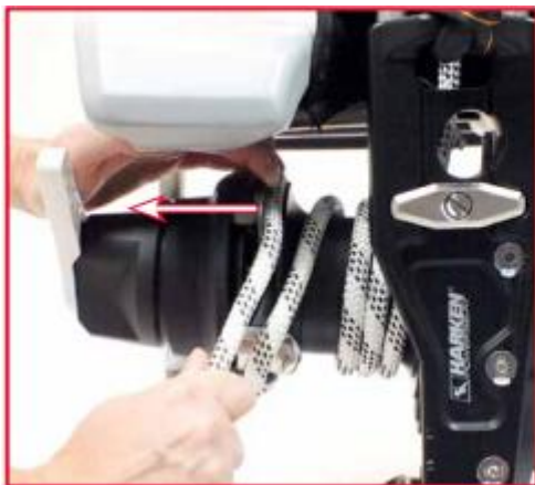
将绳索嵌入绳索抓斗器中。提起保护盖，使本步骤更容易操作。