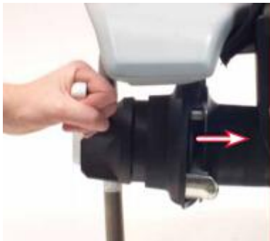
通过旋转及释放操作杆，来检查绳索抓斗器的工作情况(关闭 JAW)