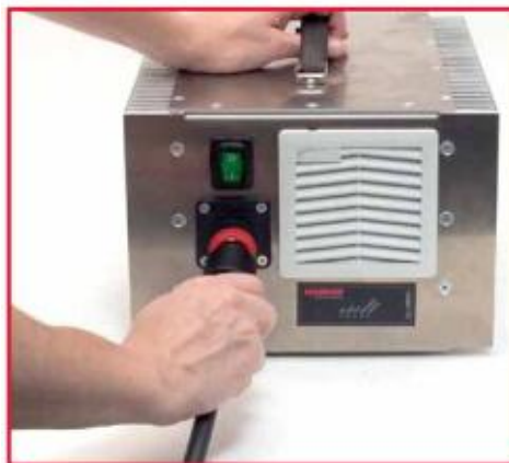
将动力电缆接入电源转换器