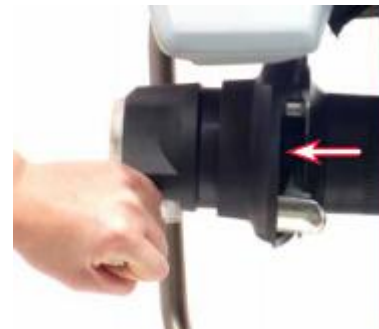
通过旋转及释放操作杆，来检查绳索抓斗器的工作情况(打开 JAW)