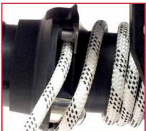
将绳索定位在绳卡里面。