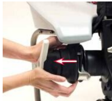
检查绳索抓斗器保护盖的活动性