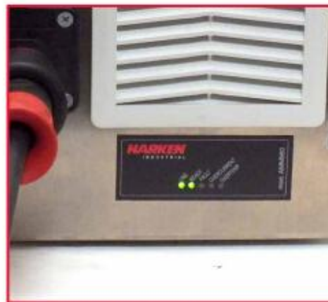
查看 LED 警示灯中的接通和准备就绪这两个灯是否亮起，以核实电源系统的工作情况，尝试运行设备，等待几秒钟通电，直至前两个 LED 灯变绿。