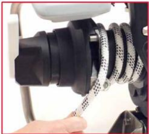
使绳索绕在绳臂上。