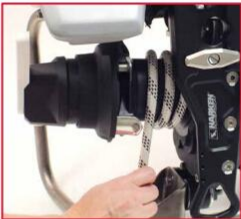
将绳索按顺时针方向缠绕在摇柄筒上。