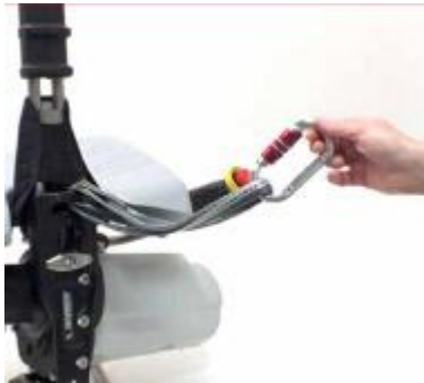
检查环带和竖钩的紧密性